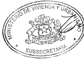
CARLOS MONTES CISTERNAS MINISTRO DE VIVIENDA Y URBANISMO MINISTRO